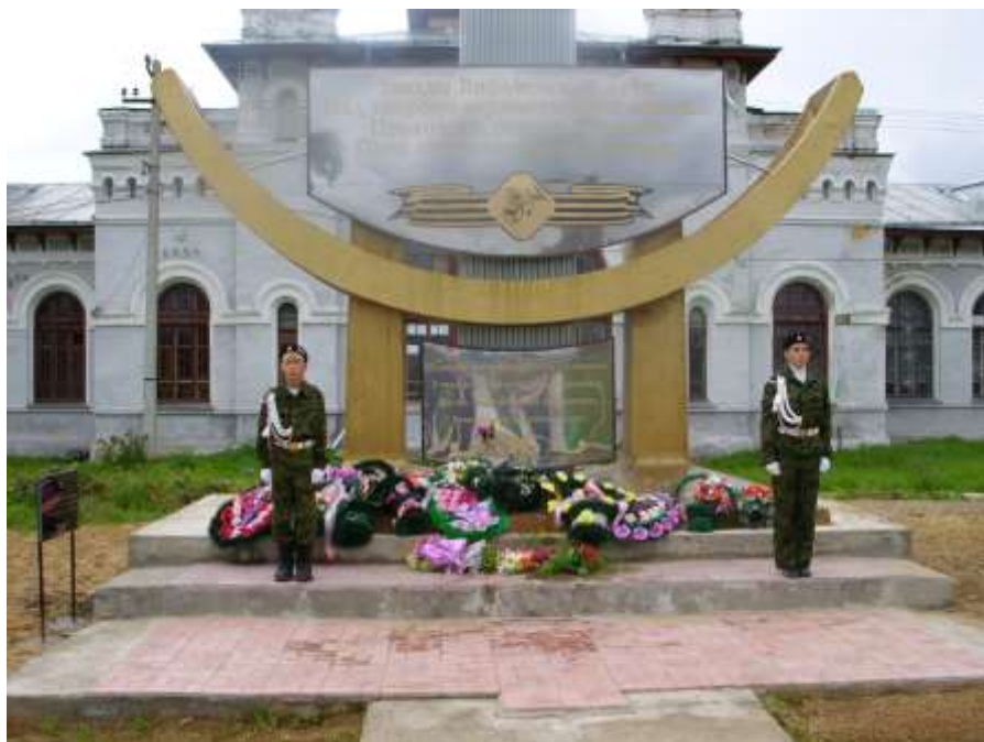
2 августа 2008г. ст. Николо-Полома. Открытие памятника землякам, павшим в войнах и локальных конфликтах.

Мемориальные доски памяти В.Болдырева открыты в с.Парфеньеве у памятника парфеньевцам, погибшим в годы Великой Отечественной войны, и в п.Николо-Полома у памятника землякам, павшим в войнах и локальных конфликтах.