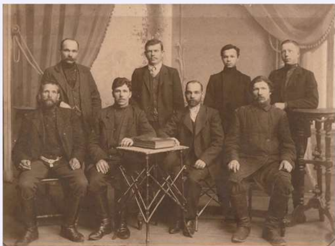
Отходники жители д.Зубарево Парфеньевский р-н

Отхожие промыслы – один из вариантов экономической деятельности, существовавший в среде крестьянства и распространенный в России XVIII – начала XX века. Максимов С.В. в очерке «Грибовник» отметил: «Парфеньев выстроился именно в такой местности, где все население давно и крепко убедилось в том, что житьем дома на не благодатной земле не проживешь; надо уходить в хорошие места, искать заработков на стороне». Это тяготение на отхожие промыслы- явление не только очень давнего происхождения, но и поразительное по обилию уходящего люда и по разнообразию способов и форм самой промышленности.