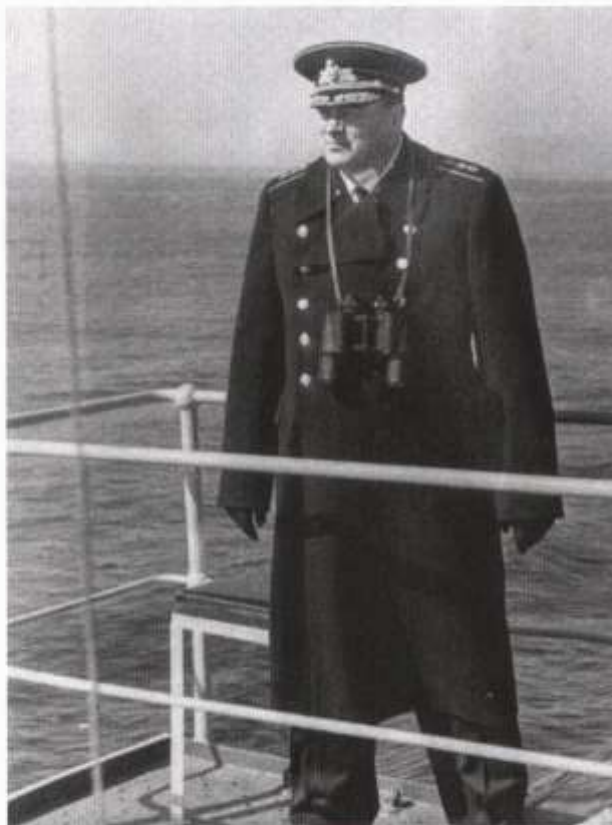
На борту крейсера «Дмитрий Пожарский». Сбор- поход под флагом командующего краснознаменным Тихоокеанским флотом, 1971 год

Любознательный читатель найдет в книге много интересных страниц из жизни Героя Советского Союза Н.И.Смирнова, узнает о его исследованиях во флотской науке.