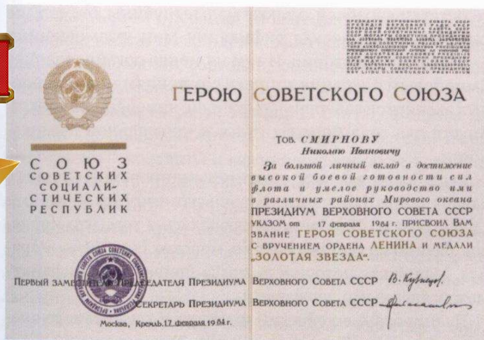
Грамота Героя Советского Союза