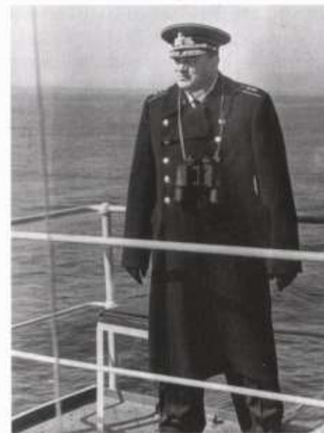
На борту крейсера «Дмитрий Пожарский». Сбор- поход под флагом командующего Краснознаменным Тихоокеанским флотом, 1971 год