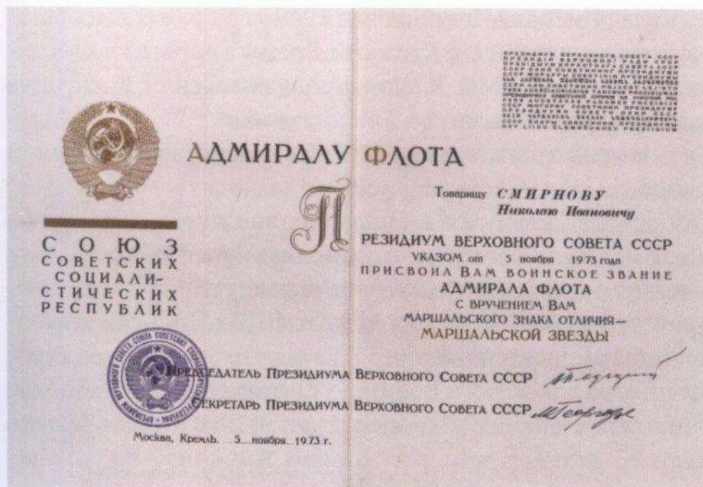
Грамота адмирала флота