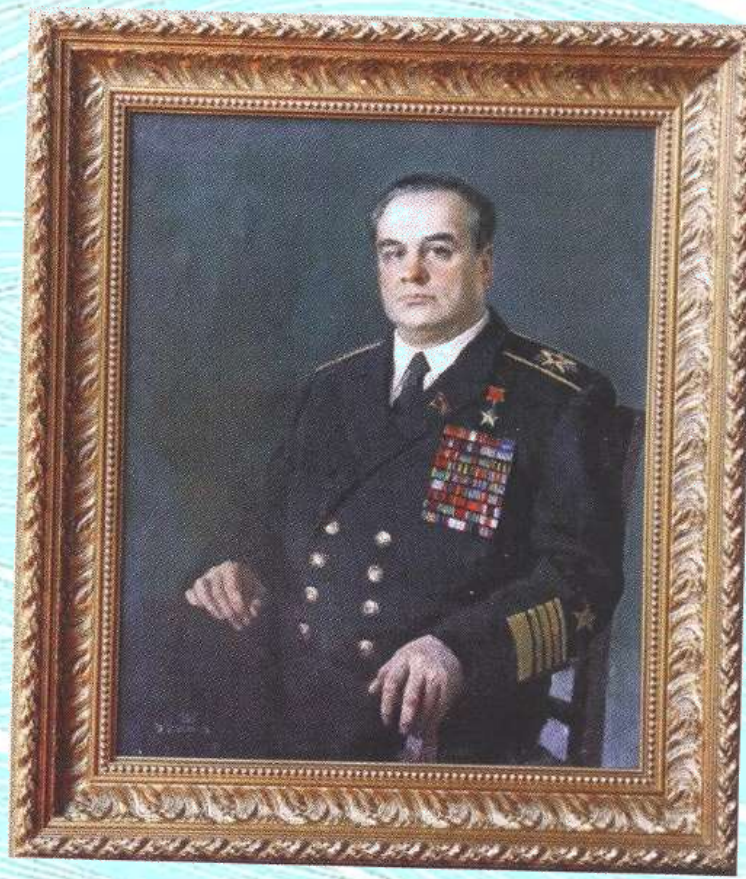
Портрет адмирала флота Смирнова, В. Печатин, 1985 г.

Сергей Николаевич рассказывает о том, что отец был дружен со многими известными людьми страны ( космонавтами, писателями). Художник В.Печатин нарисовал его портрет.