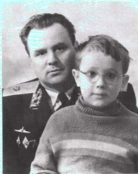
В редкие минуты общения с отцом. Начало 1960-х годов

«Слово отца было для меня законом, но он никогда своим авторитетом не злоупотреблял».