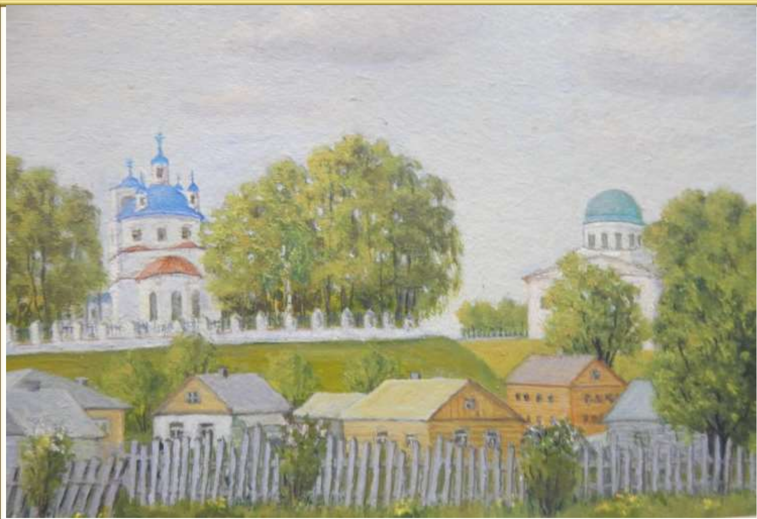
С.Парфеньево (родные места). 1971 г.