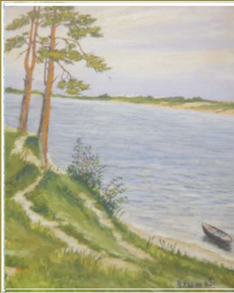
Сосны на берегу Волги. 1969 г.