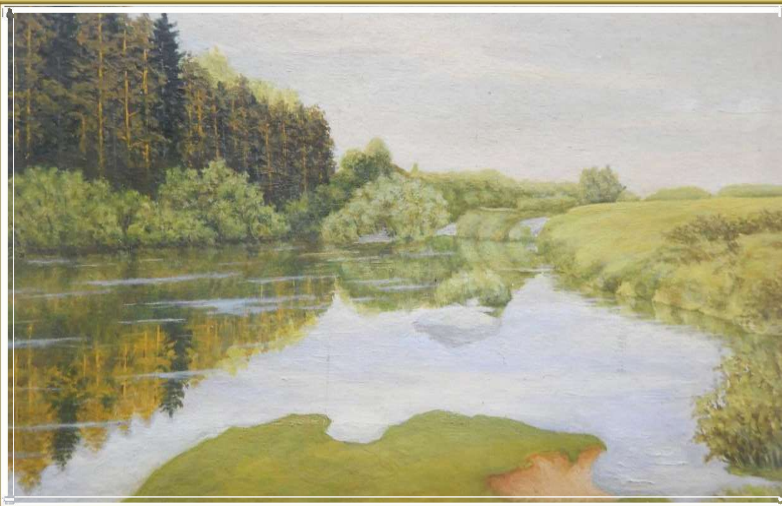
«Речная тишина» (на реке Нея). 1982 г.