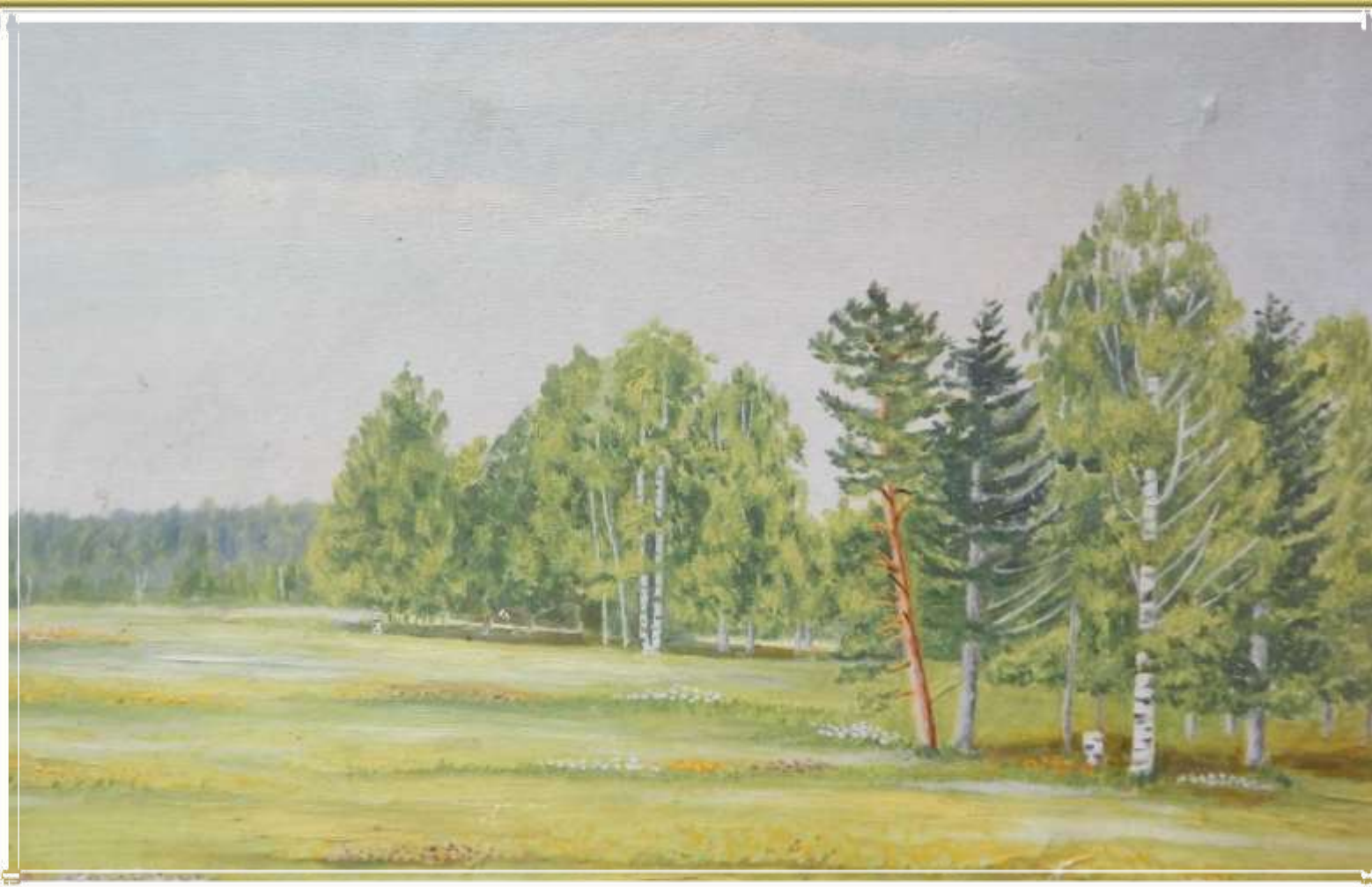
В окрестностях д.Нечаево. 1963 г.