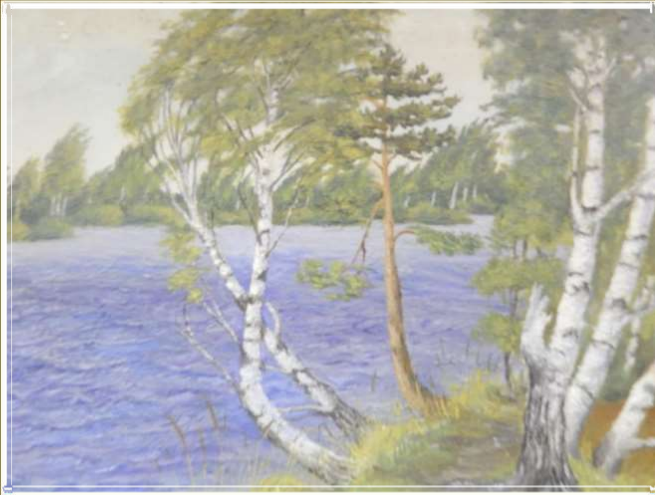
Карьер на Ляпинке. Ярославль. 1970 г.