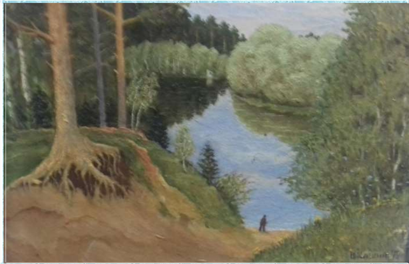
Сереее Кашину на добрую память. 1979 г.