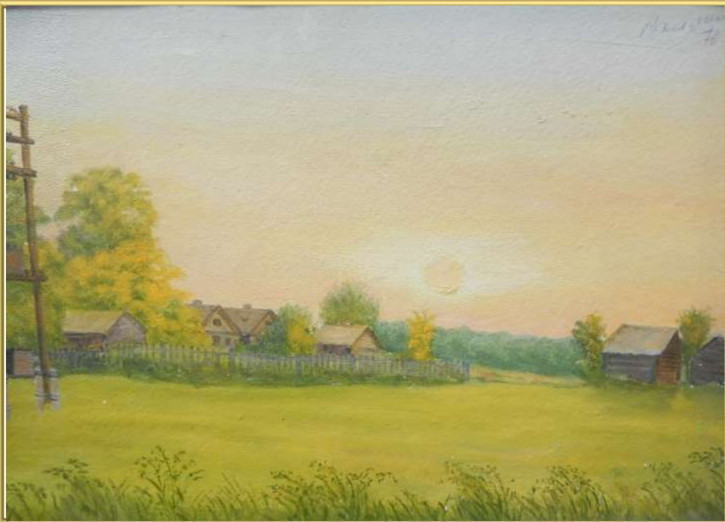
Д.Нечаево. Восход. 1976 г.