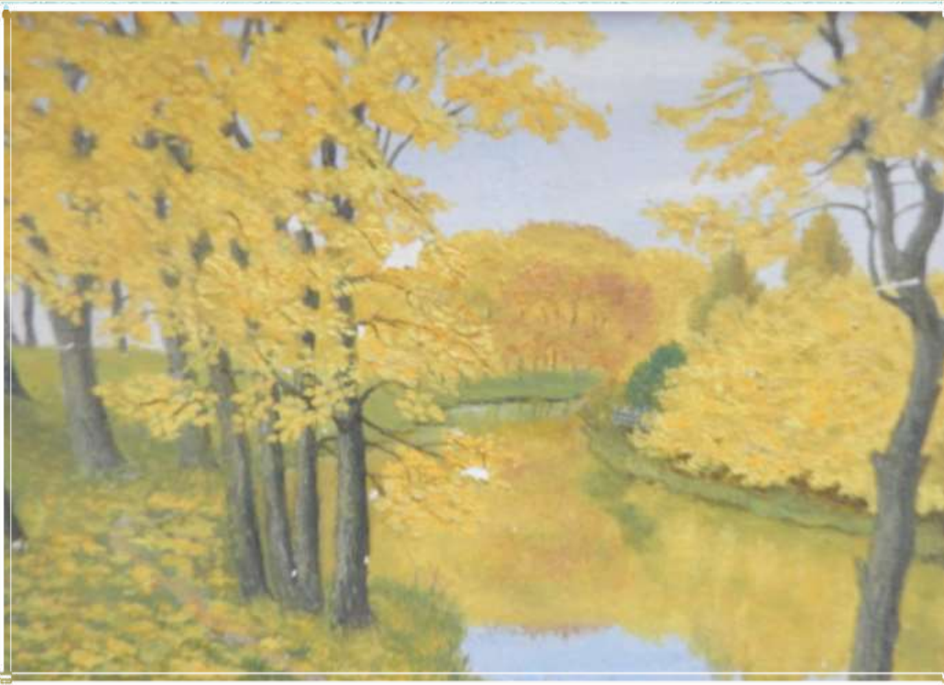
Золотая осень Ярославля. Верхний остров. 1971 г.